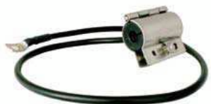
Erdungsschelle für Ecoflex®10, Art.-Nr. 6810

Die hohe Flexibilität von Ecoflex 10 wird durch einen 7-drähtigen Litzeninnenleiter aus sauerstoffarmen Kupfer sichergestellt. Der Innenleiter wird in einem speziellen Arbeitsgang komprimiert, kalibriert und anschließend mit einem Precoating versehen, um gute Dämpfungs- und Anpassungswerte zu erzielen. Ein weiterer Pluspunkt ist die doppelte Schirmung: eine überlappende Kupferfolie und ein darüberliegendes Kupfergeflecht sorgen für ein hohes Schirmmaß von > 90 dB bei 1 GHz. Der schwarze PVC-Außenmantel von Ecoflex 10 ist UV-stabilisiert. Zur Vereinfachung der Installation wurde ein hochwertiger lötfreier N-Stecker entwickelt, der ohne Spezialwerkzeug in wenigen Minuten montiert werden kann. Ecoflex 10 ist ein modernes Koaxialkabel für alle Applikationen in der Hochfrequenztechnik: dämpfungsarm, flexibel, störstrahlungssicher und einsetzbar bis in den Mikrowellen-Bereich. Lieferbar in den Standardlängen: 25 m, 50 m, 100 m, 200 m, 400 m und 500 m.