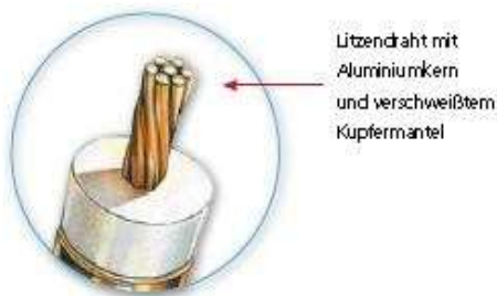
Litzendraht mit Aluminiumkern und verschweißtem Kupfermantel