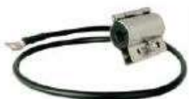
Erdungschelle für Ecoflex® 10 Plus, Art-Nr. 6812